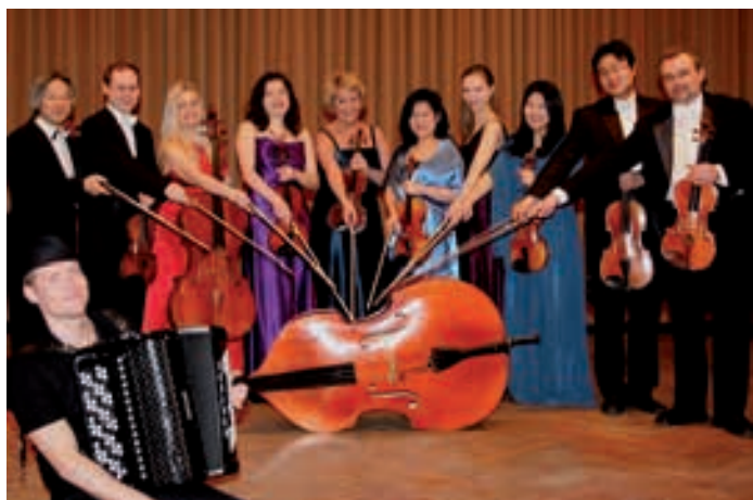
Hamburg Strings: Zehn Streicher und ein Bajan

Werke von Alfred Schnittke, Antonio Vivaldi, Edward Grieg, Antonín Dvorák, Leroy Anderson, Astor Piazzolla