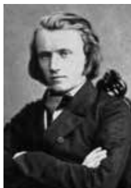
J. Brahms um 1853

Johannes Brahms komponierte die Sinfonien 1-3 in den Jahren 1853-54. Er war da 20 Jahre alt und noch nicht sehr bekannt. 1853 lernte er Robert Schumann kennen, der von Brahms schnell überzeugt war und in der „Neuen Zeitschrift für Musik“ persönlich einen Artikel über ihn schrieb.